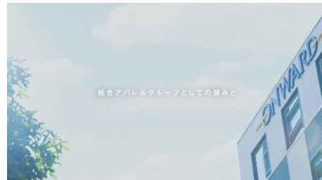
<パーパスムービー>

またパーパスの世界観を発信するパーパスムービーも制作いたしました。このムービーでは会社として行ってきたこれまでの取り組みと、これからの未来の社会に対する想いが込められています。このムービーを広く社会へ向けて発信すると同時に、従業員ともパーパスの共有をはかり、社員一丸となって取り組んでまいりたいと考えています。