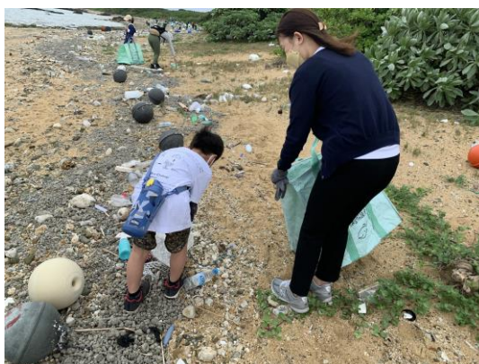
▲当社が3月に参加したビーチクリーンの様子

当社はライフスタイル提案商社の豊島株式会社が展開する、海や川のクリーンアップ活動でペットボトルゴミ等を回収し、アパレル製品原料となる繊維に生まれ変わらせるプロジェクト「UpDRIFT™」に参画しています。このプロジェクトを修学旅行のプログラムに組み込むことで、生徒自身の手でビーチ等のクリーンアップ活動を行います。さらに回収したゴミのうちペットボトルを生徒が着用する学校制服の原料に生まれ変わらせることで、海洋ゴミ問題を「自分ごと化」するきっかけを提供します。