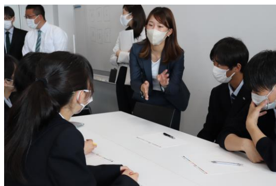
▲グループワークの様子