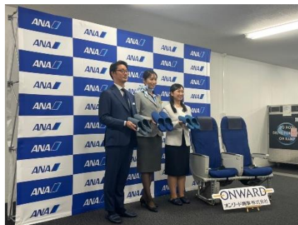
▲座席画像、会見の様子