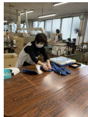
▲山形県河北町で一つひとつ手作りで生産されている様子