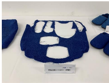
▲くり抜き前のシートカバー (左) と、くり抜き後のシートカバー (右)