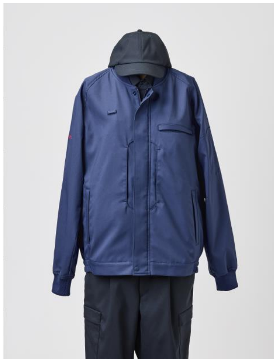
ブルゾンスタイル