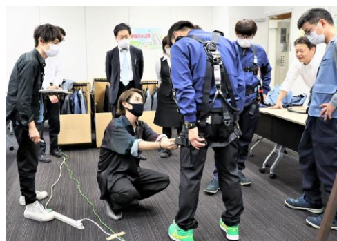
5月に名古屋で実施したキャラバンの様子

ユニホームリニューアルの過程で、従業員がサンプルを試着してプロジェクトメンバーと意見交換する全国キャラバンを実施。プロジェクトメンバーが約4か月かけて21のオフィスに足を運び、600人を超える幅広い職種・年齢の従業員の声をヒアリングしました。その結果、街で誇りをもって歩けるデザイン性を保ちながら、エレベータ・エスカレータの据付や保守といった独特な労働環境においても安全性・機能性・耐久性・快適性を確保した当社オリジナルのユニホームが完成しました。