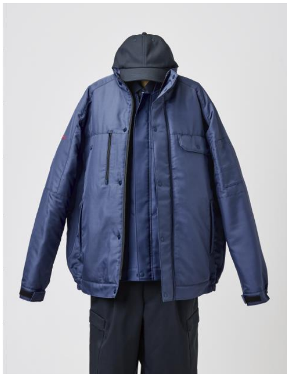
アウトースタイル