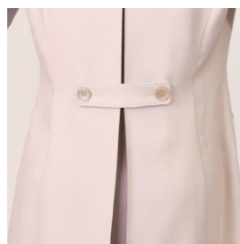
▲アクションプリーツ