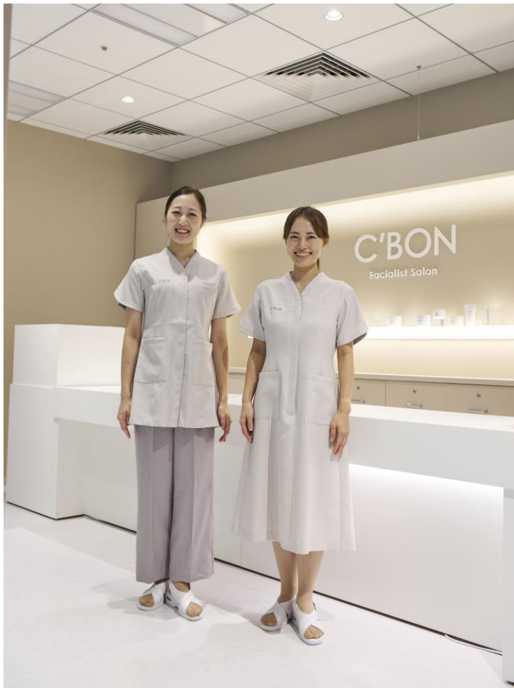
▲2024年9月1日から着用開始の新ユニフォーム

また、使用済みの旧ユニフォームの一部は回収し、コースターにアップサイクルし、サロン等で活用される予定です。