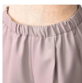
▲ウエストオールゴム