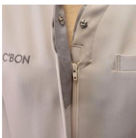
▲フロントファスナー