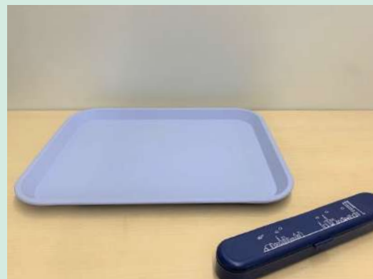
株式会社東横イン様のワンウェイプラスチックをリサイクルした取り組み事例(朝食トレイ、歯ブラシケース)