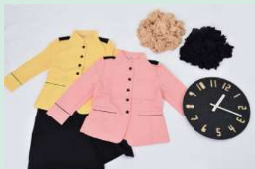
株式会社東横イン様の廃棄対象の制服3.5tを時計にアップサイクルしました。

ワークスタイルデザイン事業の製品及び生地の廃棄においては、発生率が増加となりましたが100%リサイクル処理を行う事ができました。今後、計画生産の精度を高めるとともに、デジタルでユニフォームのサイズをレコメンドするデジタル採寸ツール「UOS」、立体デザインを組み上げる事が可能な3DCADシステム「CLO」の活用を継続して推進していくこと等により、無駄のない受注生産・計画生産に取り組み、最終的に廃棄対象となってしまった製品・生地については継続して再資源化処理を行います。