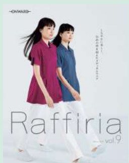
医療従事者向けウェア「ラフィーリア」

製品だけでなく、梱包資材の不使用や環境配慮型 (FSC認証の活用やバイオマス由来、生分解性資材) へのシフトを推進します。