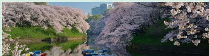
千代田区観光協会 東京大回廊写真コンテスト入選作品「ある春の朝の水鏡」三石 雄大氏