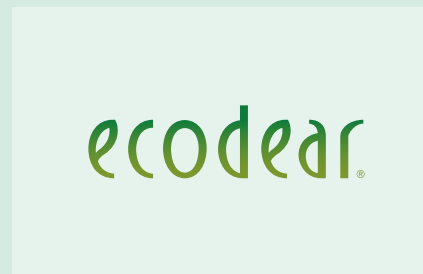
※エコディア®は東レ株式会社社のバイオマス由来ポリマー素材・製品の統合ブランドです。