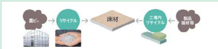
※田島ルーフィング株式会社社の環境配慮商材