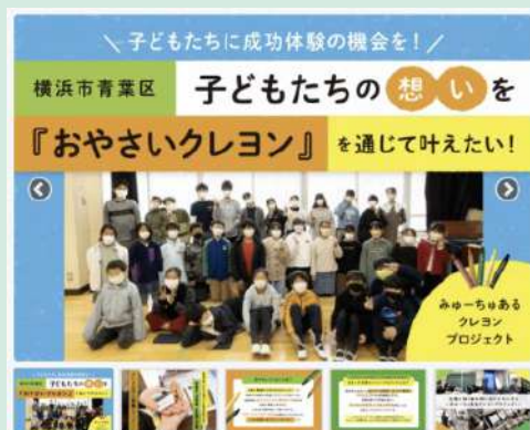
富国生命保険相互会社様と廃棄野菜からクレヨンを制作した取り組み事例

国際認証のオーガニック素材やリサイクル素材を使用した環境負荷低減につながる製品を推進します。また、これらの製品での販促活動により、持続可能な社会形成への消費者意識醸成に努めます。