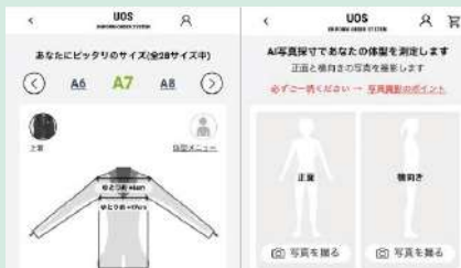
デジタル採寸ツール「UOS」