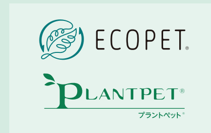
※エコペット®は帝人フロンティア株式会社のリサイクルポリエステル素材・製品の商標です。プラントペット®は、植物由来成分を原料の一部として使用した帝人フロンティア株式会社のポリエステル素材の商標です。