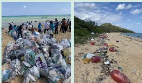
※UpDRIFT®、アップドリフト®は豊島株式会社社の商標です。