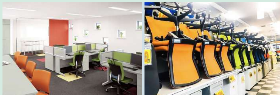
什器等のリユースを推進する「オフィスバスターズ」

ソリューションデザイン(インサイトセールス)事業においては廃棄製品発生率が増加となりましたが、リサイクル処理率は向上しました。また、ソリューションデザイン(スペースクリエイト)事業においてはオフィスバスターズの活用により什器類のリユースを推進いたしました。引き続き品質の向上と検品体制の強化に努めて、品質不良による廃棄品を削除します。