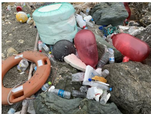
(約 110 人でビーチクリーン)