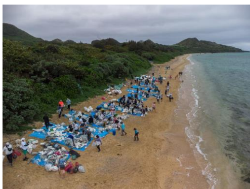
(約 110 人でビーチクリーン)