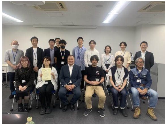
〈ワークショップ終了後、参加者による集合写真〉

成果発表会では、称賛アプリと社内の自動販売機の紐づけや、社内副業マッチングアプリ等のアイデアが出て、「テーマに合致しているか」、「新規性・独創性があるか」「社内へのインパクトがあるか」「実現性があるか」の4つの評価項目をもとに、社長、各グループ長、社外の専門家が評価を行いました。最優秀に選ばれたのは、若手社員間のスキルの差を課題と捉えて、性格診断を用いたマッチングシステムの導入を提案したチームで、他の案も含め、具現化に向けた検討が始まっています。